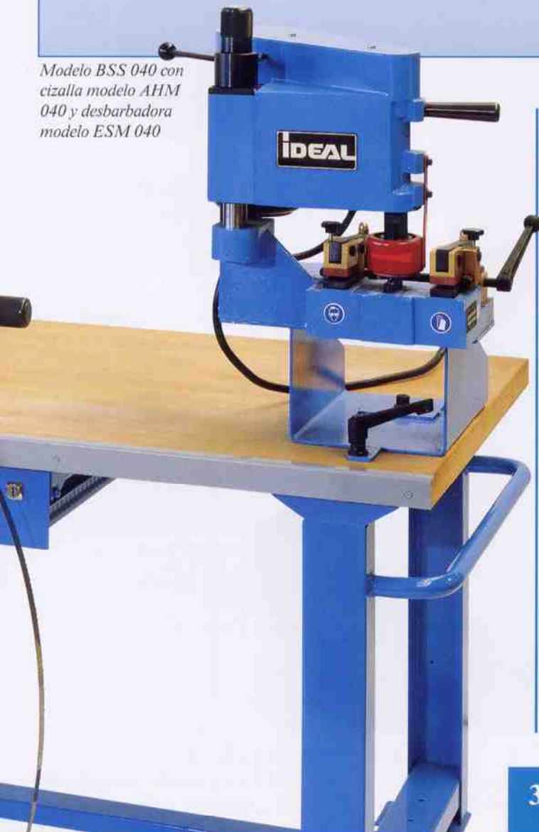
Modelo BSS 040 con cizalla modelo AHM 040 y desbarbadora modelo ESM 040