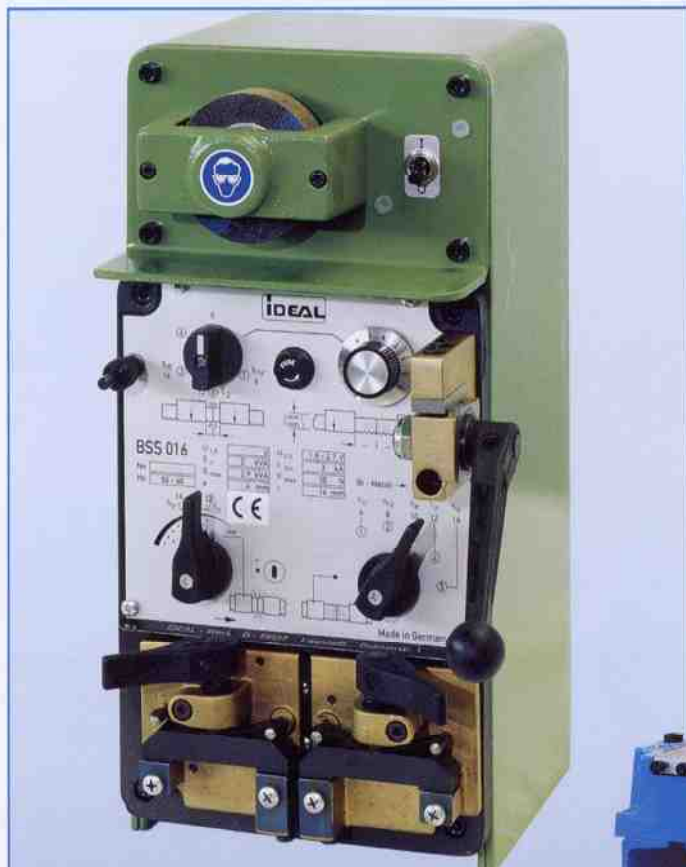
Modelo BSS 016 / BSS 025 con cizalla AHM 025, desbarbadora modelo ESM 025 y dispositivo electrónico de revenido modelo EG – también está disponible sin caja para la incorporación en máquinas de sierra cinta