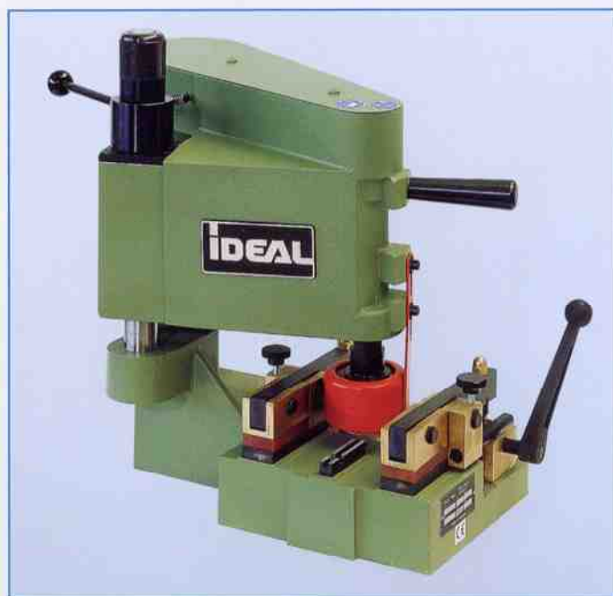
Desbarbadora modelo SMH 060