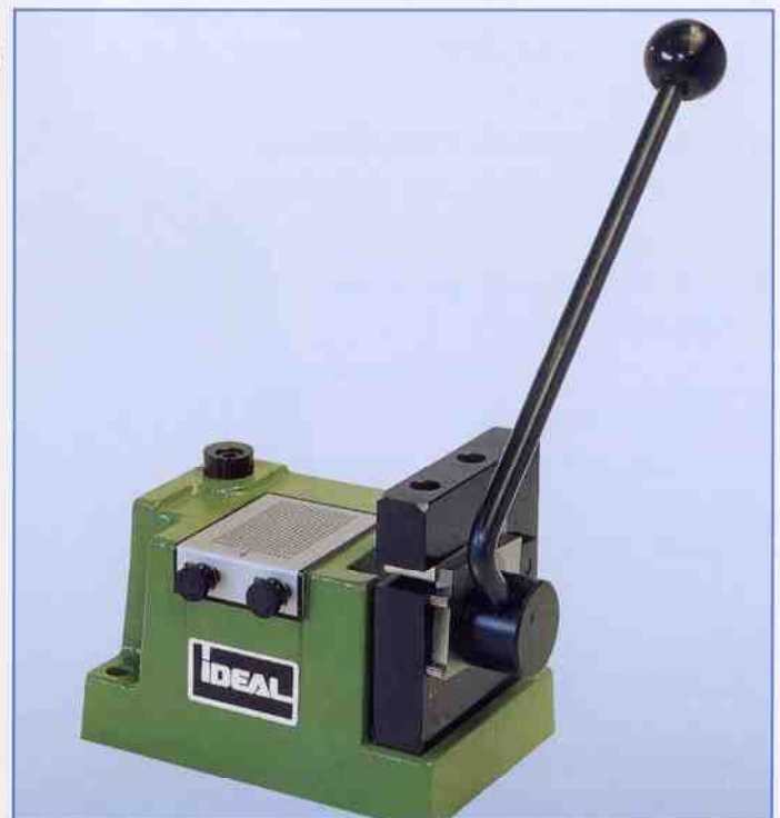
Cizalla modelo AHE 050