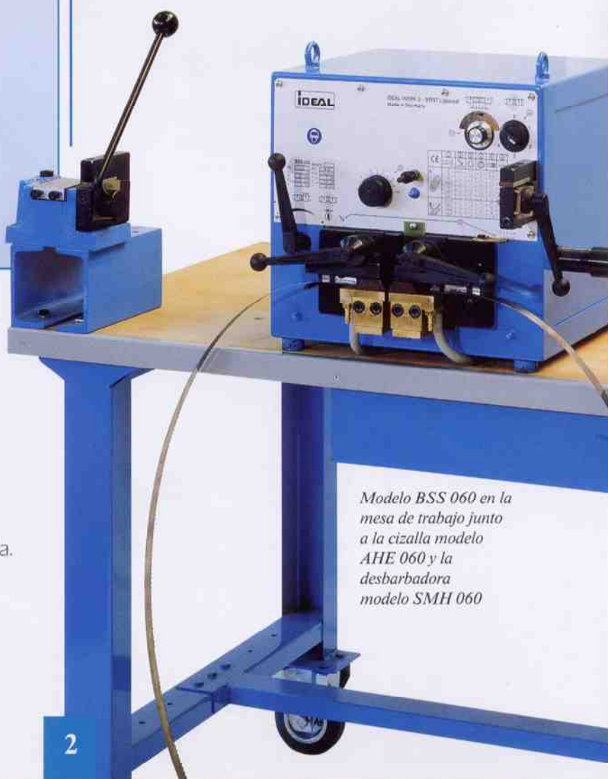
Modelo BSS 060 en la mesa de trabajo junto a la cizalla modelo AHE 060 y la desbarbadora modelo SMH 060